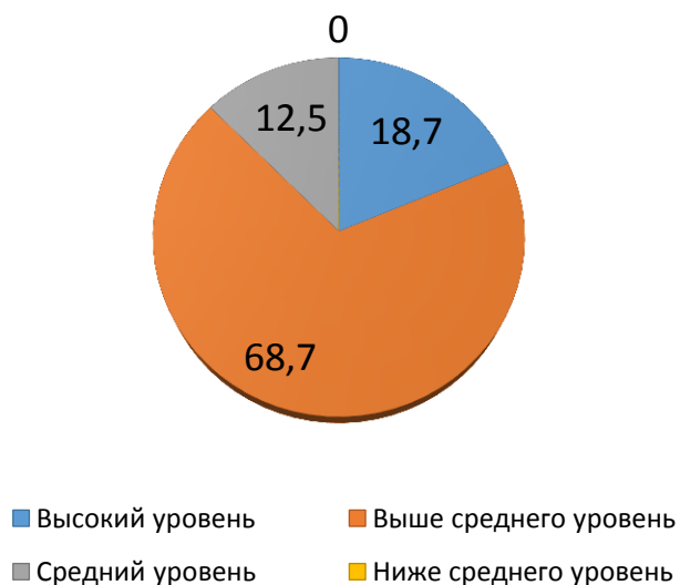
Результаты сформированности предпосылок к учебной деятельности май 2019 год